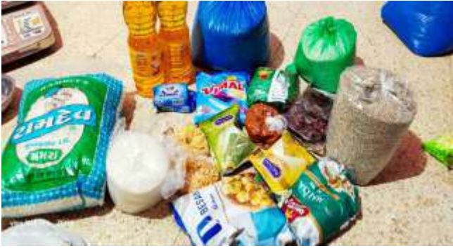
AIMJF Youth Wing of Gir Gadhada distributed 55 premium ration kits (Saurashtra Zone) to needy families. Each kit costed Rs.1280/- Under the guidance of Mr Javed bhai Bijliya (In charge of Aimjif Youth Wing Gir Gadhada) and team.