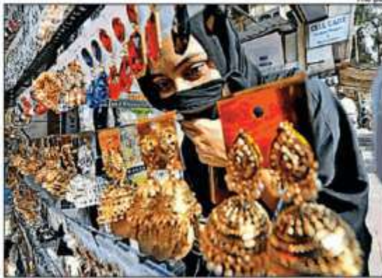
The faithful may have shopped like this before, but now is the time to give