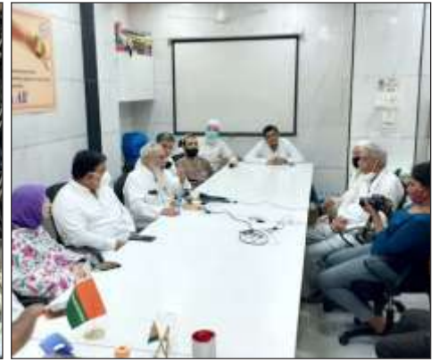
Oxygen Distribution Meeting & Planning at AIMJF Office