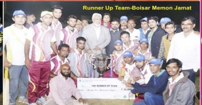
Runner Up Team-Boisar Memon Jamat