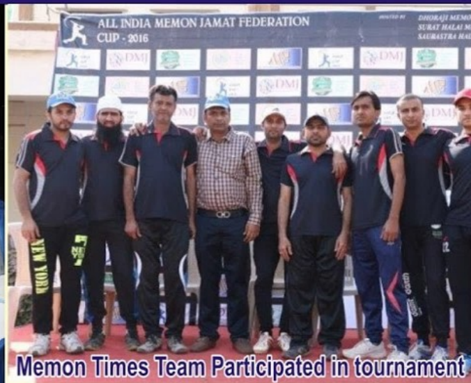
Memon Times Team Participated in tournament