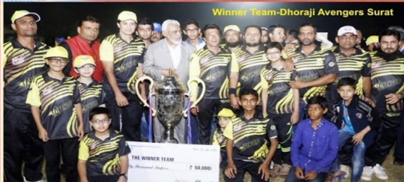
Winner Team-Dhoraji Avengers Surat