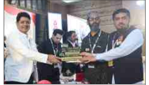
Khwaja Garib Nawaz Welfare Trust, Surat