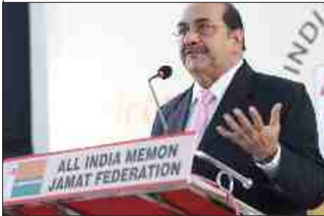
Hon'ble Justice Abhay Thipsay