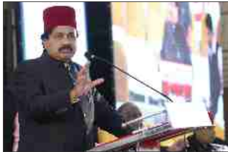
Hon'ble Mr Sunil Tatkare Member of Parliament