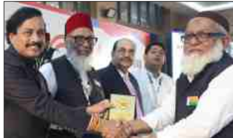
Parbhani Memon Jamat by MP Sunil Tatkare