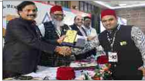
Bakhla International Travels by hands of MP Sunil Tatkare