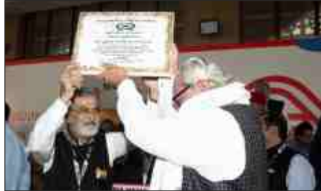
Father of Memons title by Chotani Memon Jamat & Batliwala Family