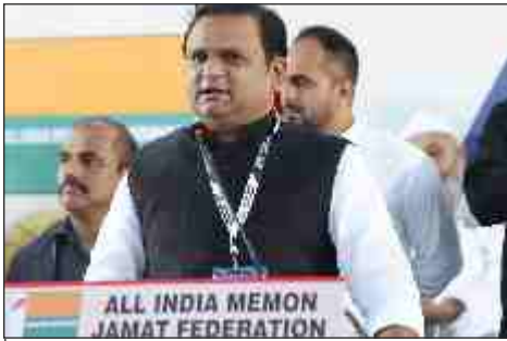
Hon'ble Speaker of Maharashtra Assembly Mr Rahul Narvekar