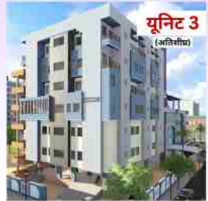
यूनिट 3 (अतिरिक्त)