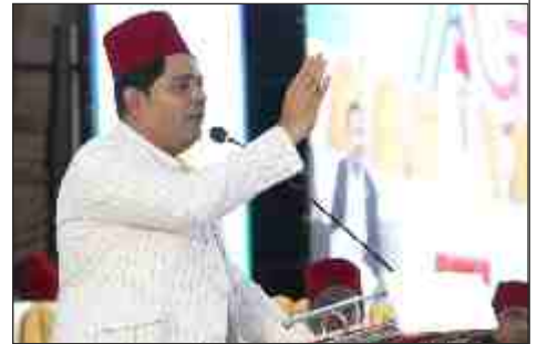
Hon'ble Mayor of Raipur Mr Ayjaz Dhebhar