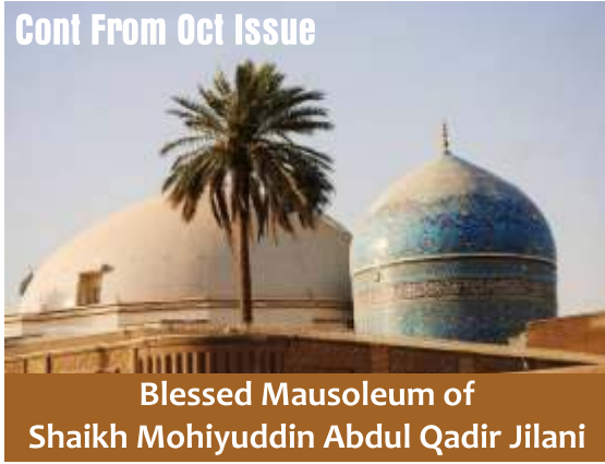
Blessed Mausoleum of Shaikh Mohiyuddin Abdul Qadir Jilani

A lthough all manner of miracles have come through him to prove this state, he has nothing to do with them. In his state there is no disclosure of secrets, because divulging the secret of divinity is infidelity. In a book called Mirsad it is written, 'All men through whom miracle appears are veiled from and unconcerned about their states. For them, the time when miracles appear are considered to be like the periods menstruation for women. Saints who are intimate with Allah have to travel through at least a thousand stages, the first of which is the door of miracles. Only those who are able to pass through this door unharmed can reach the