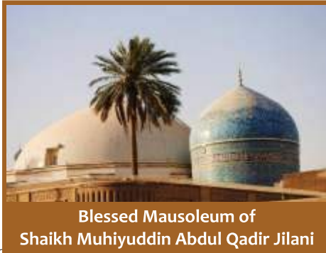
Blessed Mausoleum of Shaikh Muhiyuddin Abdul Qadir Jilani

The First Discourse: Three things are indispensable for a believer in all conditions of life: 1. He should keep the commandments of God. 2. He should abstain from the forbidden things. 3. He should be pleased with the decree of Providence. Thus the least that is expected of a believer is that he should not be without these three things. So he should make up his mind for these and talk to himself about them and keep his organs engaged in them. The Second Discourse: Follow faithfully (in the footsteps of the Holy Prophet) and do not create innovation and remain obedient (to God and His Prophet) and do not transgress. Uphold the Unity of Godhead and do not ascribe any partner to Him; and conceive Him in His Holiness and do not ascribe any evil to Him. Maintain His truth and do not give way to double-standards; and remain patient and do not run away; and apply to Him for your needs but do not feel annoyed but wait, and be united in obedience and do not be disunited. Love one another and do not bear spite towards one another, and keep free from vices and do not be contaminated or defiled