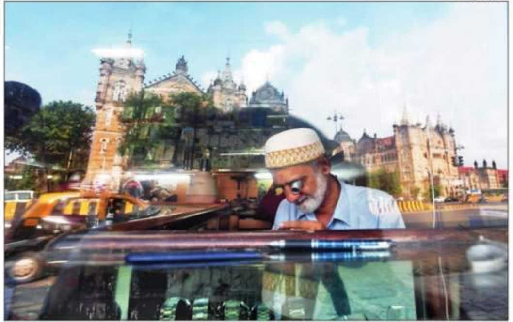
TIMELESS: A watch repairman busy with work opposite the iconic CR HQ at CSMT

The 40th annual general meeting and convention of the All India Memon Jamat Federation in the city turned out to be a fascinating event where around 1,000 guests witnessed speakers hailing the Memons' services to the nation. From establishing businesses to creating jobs, building hospitals and houses for the poor to distributing ration and oxygen cylinders and concentrators during the pandemic, the Memons have led charity works from the front. They underlined that it was a Memon, Dada Abdullah, who found a job for Mohandas Karamchand Gandhi, much before he became Mahatma Gandhi, as assistant to his counsel at his firm in South Africa. Referring to Gandhi's well-thumbed autobiography where he details the circumstances in which he went to