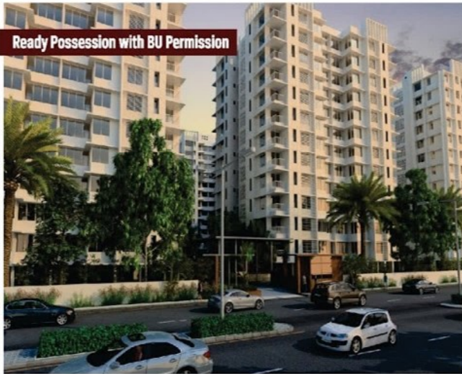
Ready Possession with BU Permission

વિચારવું એ રહ્યું કે એ વ્યક્તિ થોડાક મીટર અને પછી એક કીલોમીટરની દોડ પછી સ્વીકારી ચૂક્યો હતો કે મારી ક્ષમતા અહીં પુરી થઈ ગઈ. તો આ બાકીની શક્તિ ક્યાંથી આવી? મિત્રો! આનું નામ જ છે ફહાની શક્તિ જે આપણાં બધાંના અર્ધ જાગ્રત મનમાં છુપાયેલી રહે છે. આ સુમ શક્તિઓને ઓળખી એને બહાર લાવીને તેનો જીવનના તમામ તબક્કાઓમાં મહત્તમ સફૂઉપયોગ કરવો જોઈએ. જેથી કરીને ગૌરવપ્રદ જીવન જીવવામાં સરળતા રહે અને જે ક્ષેત્રમાં કામ કરતા હોઈએ એમાં વધુમાં વધુ સફળતા પ્રાપ્ત કરી શકાય.