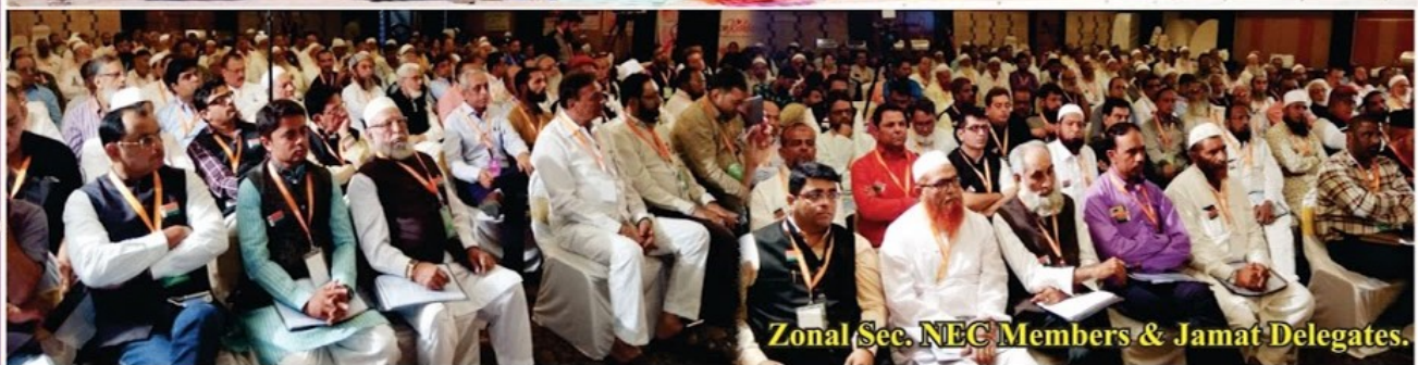
Zonal Sec. NEC Members & Jamat Delegates.

9th Board Meeting of AIMJF was held on Sunday, 29th October, 2017 at 10.30 am in the Banquet Hall of Rivera Sarovar Portico (Khanpur, Ahmedabad)