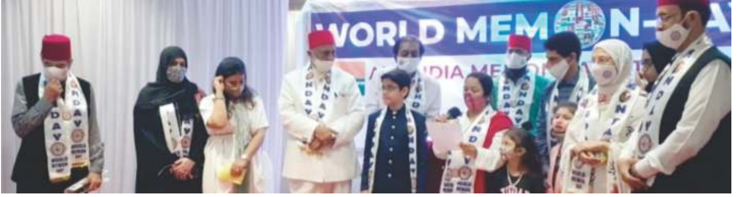
Hon'ble Mayor of Mumbai Smt. Kishori Pednekar addressing World Memon Day 2021 Celebration in Mumbai.