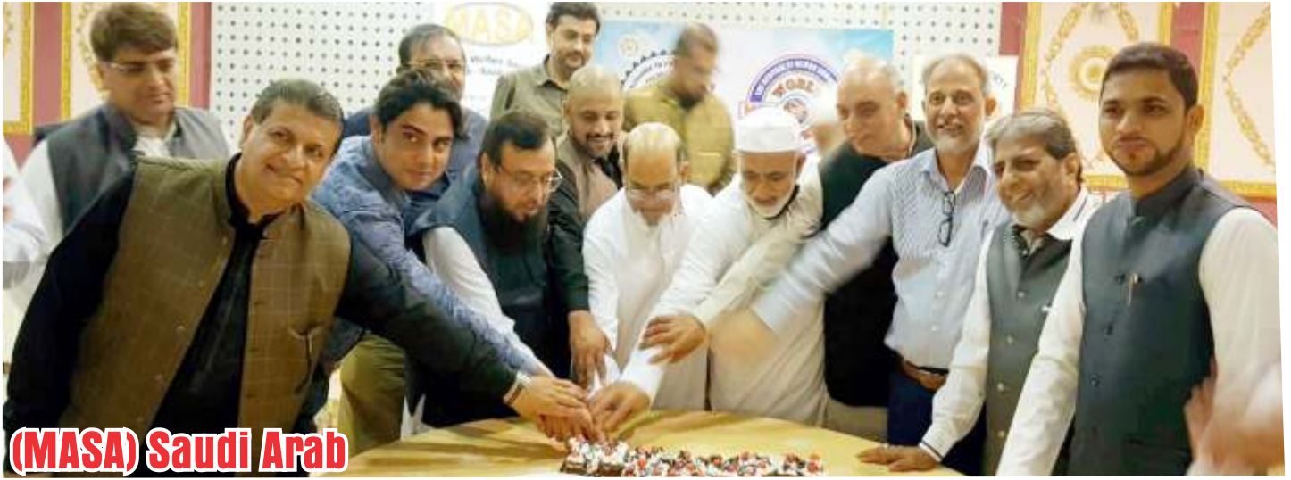
(MASA) Saudi Arab