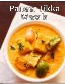
Paneer Tikka Masala

Ingredients: For Tikka: 200 gms (7 oz) Paneer (Cottage Cheese), cut into 1-inch cubes | 1 teaspoon Ginger-Garlic Paste | 1/4 cup Hung Curd or Thick Curd | 1/2 teaspoon Tandoori Masala Powder, optional | 1/2 tablespoon Cumin-