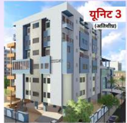
यूनिट 3 (अतिथीघर)