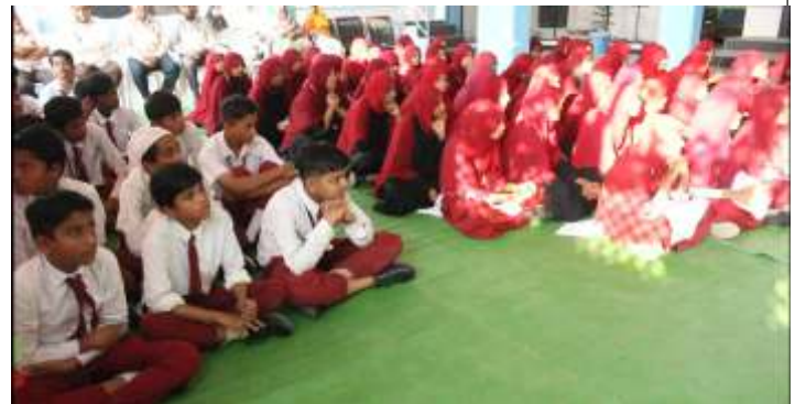
Students of Unique Educational Welfare Society School

Subsequently, the Unique Educational Welfare Society School warmly welcomed all the guests by adorning them with shawls and presenting tokens of appreciation. Later, all the attendees shared their thoughts and experiences. At the end, a vote of thanks was extended to all the guests by the Unique Educational Welfare Society School. The success of this program was attributed to the dedication and hard work of all the responsible individuals from the Unique Educational Welfare Society School.