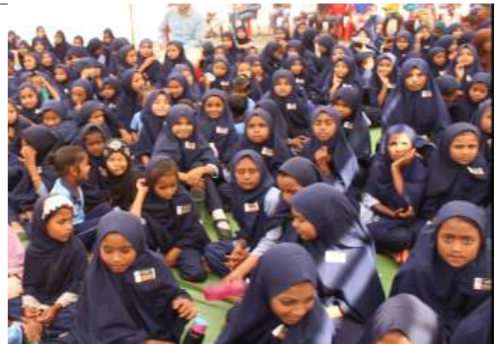
Students of All India Memon Jamat Federation Urdu School, Jalgaon