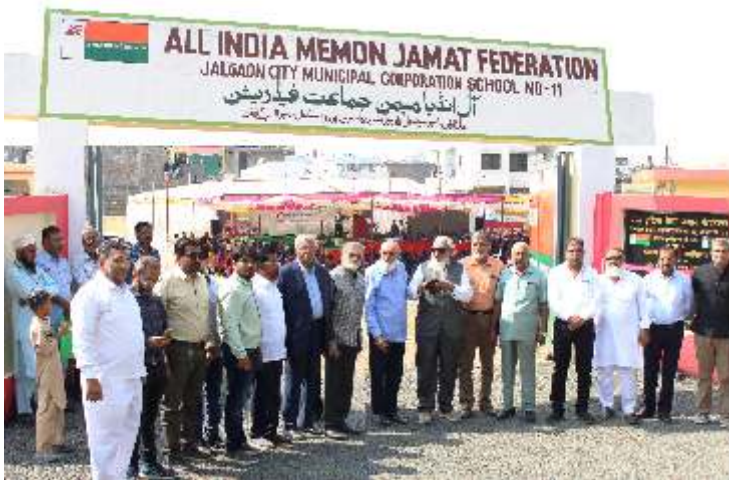
Team of AIMJF delegates & Jalgaon Memon Jamats at AIMJF Urdu School in Jalgaon