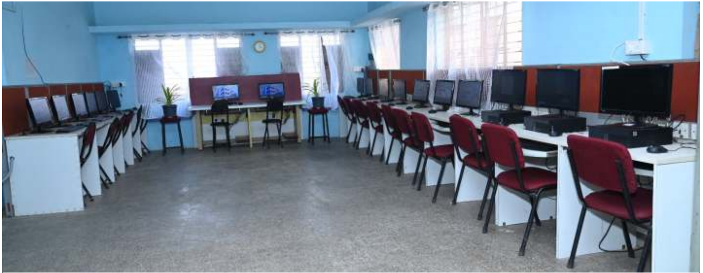
Unique Educational Welfare Society School ICT Laboratory