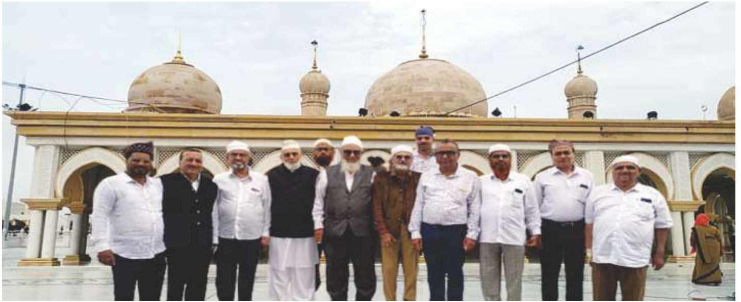
All India Memon Jamat delegates visit to Hazrat Sayed Tajuddin Shah Baba Dargah in Nagpur.